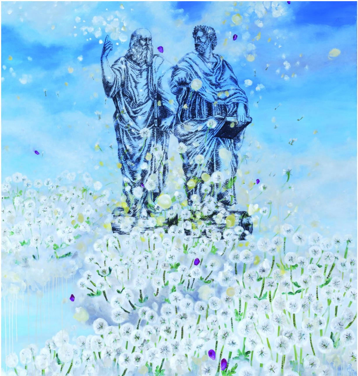
Zeitgeist der Philosophen, 2008 180 x 170 cm Öl auf Leinwand

Das Kunstwerk: „Zeitgeist der Philosophen“ von Yvonne van Acht