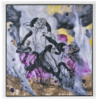
Sophokles' Laokoon, 2008